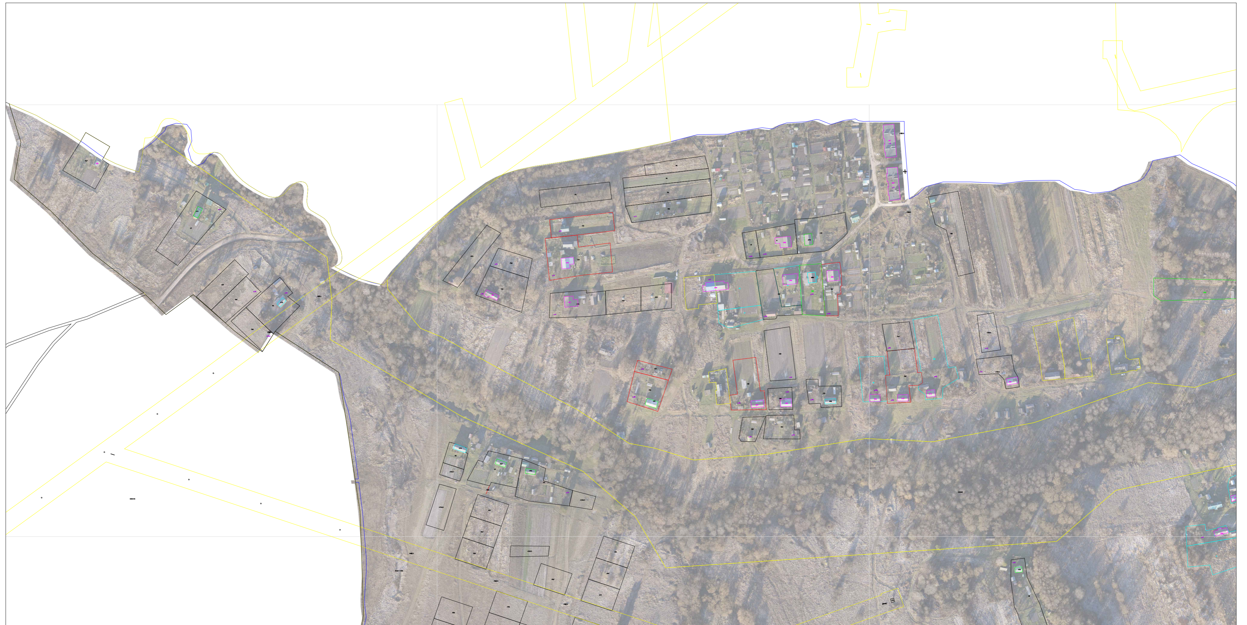
Схема границ земельных участков